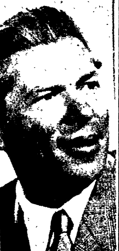
György Marosan, ministro del governo Kadar

Tutte le fiamme hanno distrutto tutto ciò che hanno trovato loro cammino per una profondità di otto chilometri. Un cadavere è stato ritrovato carbonizzato. I pompieri della contea di Los Angeles lottano contro il fuoco notte e giorno, ma ancora non sono riusciti a domarlo. Il vento impetuoso aiuta le fiamme a propagarsi con straordinaria rapidità. Si prevede che queste disastrose condizioni meteorologiche continueranno per parecchi giorni ancora.