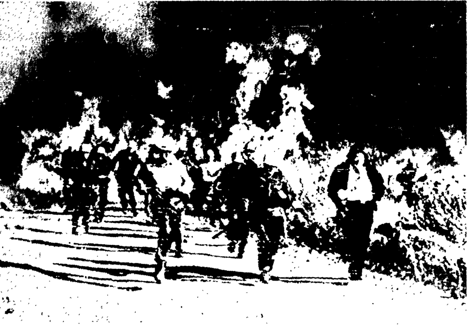
MALIBU (California) — Quindici ettari di foresta sono stati distrutti in cinque giorni dal più disastroso incendio che abbia mai colpito la California. Diecimila vigili sono stati impiegati nelle operazioni di spegnimento, che solo ieri hanno permesso di controllare e circoscrivere il fuoco. Qui sopra: un gruppo di pompieri costretti a fuggire, per sottrarsi dal calore delle fiamme.

rapporti dei servizi di spionaggio, mentre i corrispondenti dei giornali si sbracciano a mandare e rievocano i sigli accardi che sarebbero intercorsi fra alcuni paesi arabi e l'URSS o altri paesi socialisti. Così oggi il N. Y. Herald Tribune, con un servizio da Damasco, secondo il quale «tecnici sovietici starebbero per assumere il comando effettivo dell'esercito siriano», lo stesso giornale definisce come segue i «due aspetti della dottrina Eisenhower»: «La protezione militare riguarda solo il caso di una aggressione militare diretta da parte dell'URSS, da sola o di concerto con qualche nazione del Medio Oriente. Rimarrebbe ancora il pericolo di una conversione comunista che evocasse di nuovo l'infiltrazione sovietica, o di espansione nazionalista o economica. In