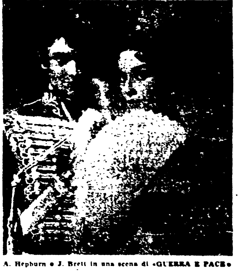
A. Hepburn e J. Brett in una scena di «GUERRA E PACE»