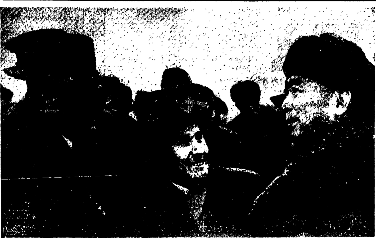
BUDAPEST — Ciu En-lai dopo il suo arrivo conversa all'aeroporto con alcuni membri del governo Kadar