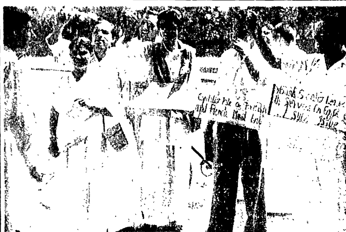
CALCUTA - La gioventù indiana non ha mancato di far sentire la propria condanna agli aggressori dell'India. Nella foto: un gruppo di studenti manifesta nei giorni del colpo di mano anglo-francese. Dicono i cartelli: «Deve finire la politica imperialista dell'Inghilterra e della Francia». «La Lega dei giovani socialisti offre il suo appoggio all'India».