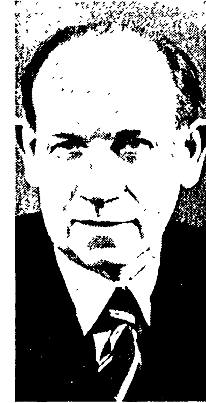
Il compagno Zapotocki presidente della Repubblica polacca cecoslovacca