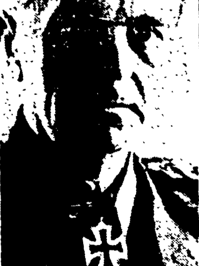
Von Paulus quando faceva parte dell'esercito tedesco

Il maresciallo Von Paulus è morto nella sua casa a Dresda. Comandò le truppe tedesche a Stalingrado - Il 2 luglio del 1954 parlò della propria svolta politica che lo condusse a condannare il riarmo della Germania