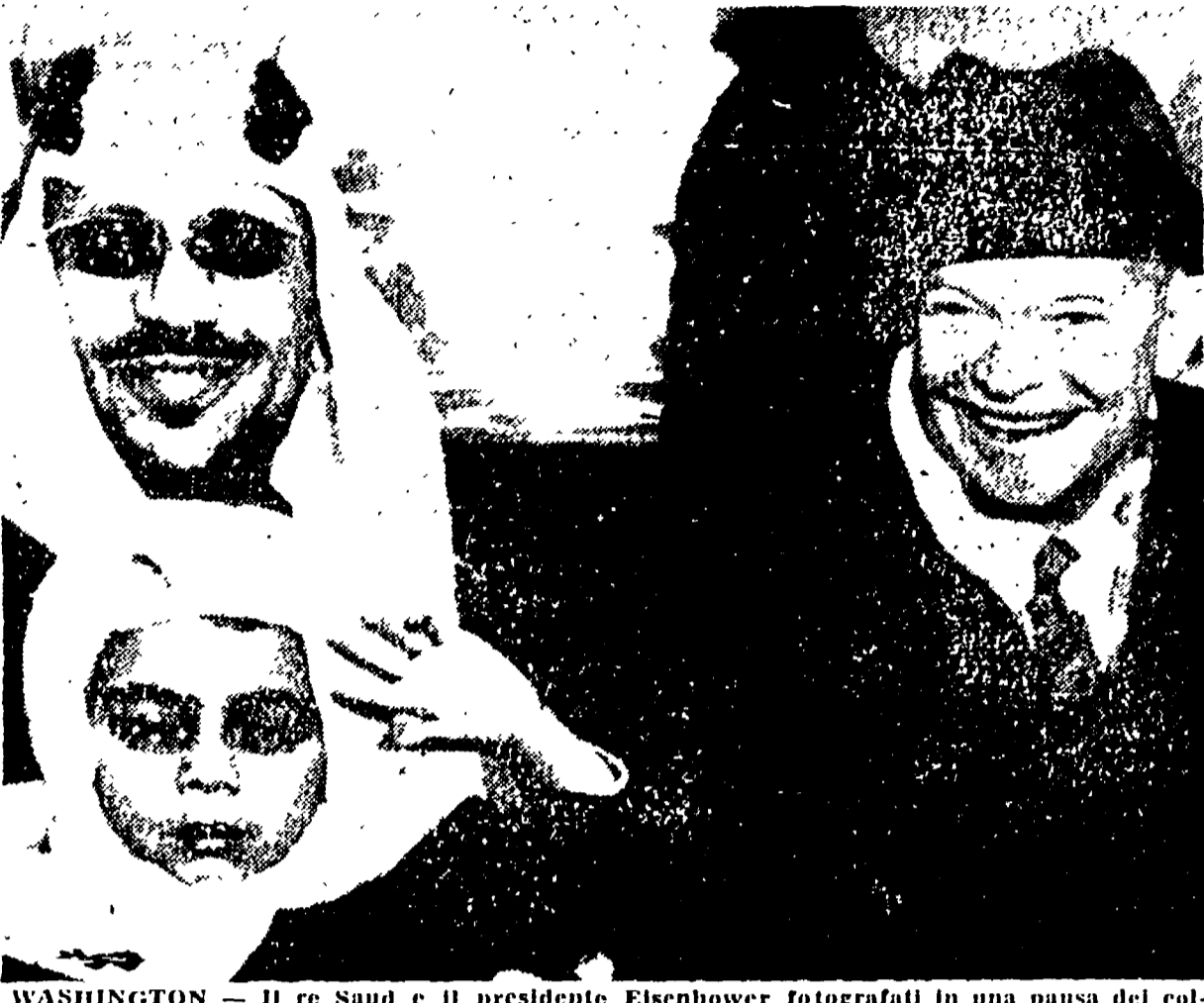
WASHINGTON - Il re Saud e il presidente Eisenhower fotografati in una pausa dei colloqui. Con Saud è il figlio.

Il prolungamento dei colloqui può voler dire che nel corso di essi sono emerse difficoltà difficili da superare. Saud, come è noto, ha preteso interamente, dal punto di vista finanziario, dalle royalties che gli vengono pagate dalle compagnie petrolifere americane. Tuttavia questo non significa necessariamente che egli debba sottostare al volere del governo di Washington, tanto più che per rimanere al suo posto, e continuare a garantire gli alti profitti dei petrolieri, egli deve fare i conti con l'opinione pubblica araba, la quale gli impone l'amicizia con i paesi che sono alla testa del mondo nazionale arabo, quali l'Egitto, la Siria e la Giordania. Tuttavia, nel corso di un pranzo offertogli sabato sera alla Casa Bianca, re Saud avrebbe pronunciato parole a favore della NATO, e del «rispetto della autodeterminazione dei popoli» da parte del presidente Eisenhower. Si apprende inoltre che al termine della sua visita a Washington, egli si recerà in Spagna dove sarà ospite di Franco.