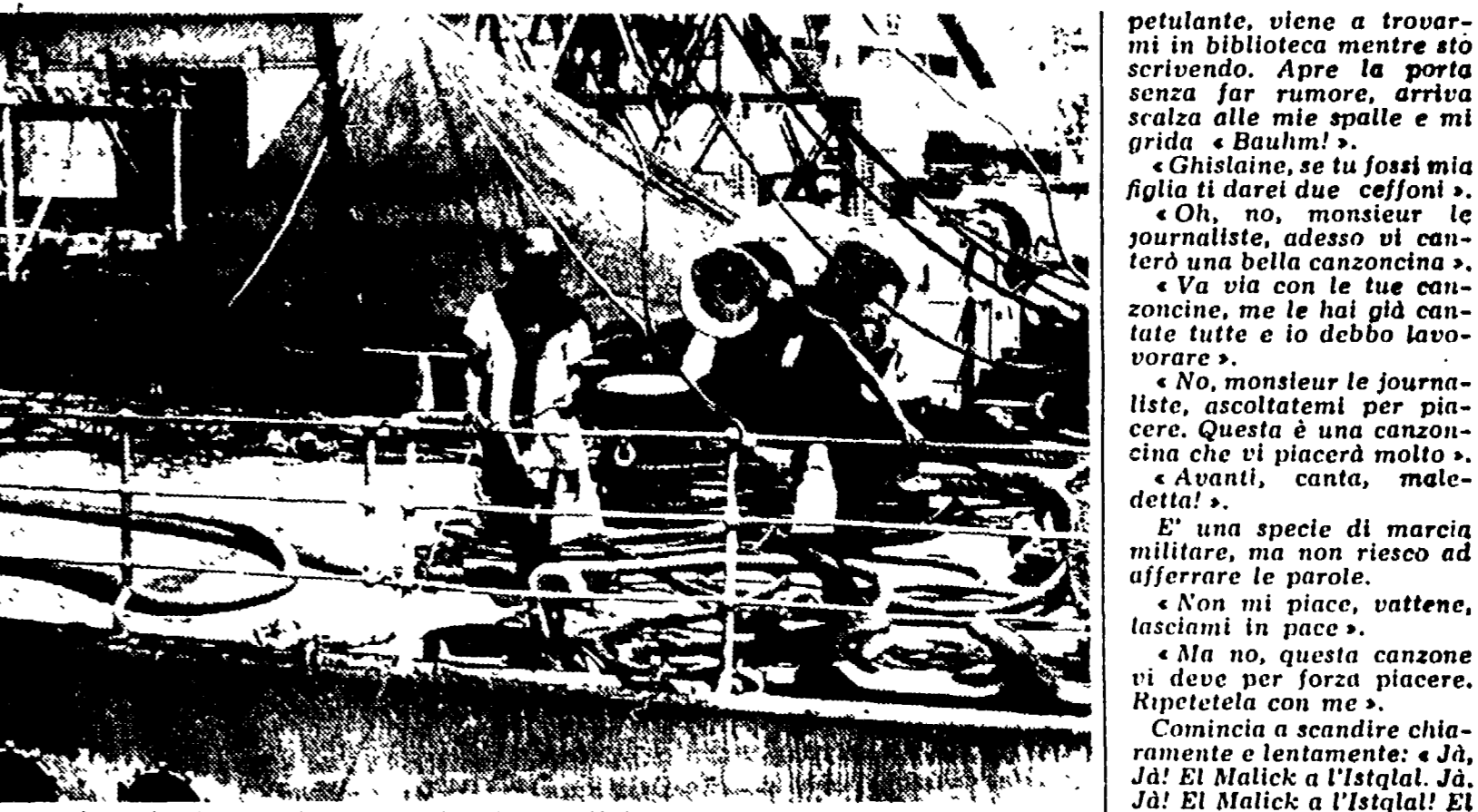
Operai negri nel porto di Mombasa (Kenya). Il più importante scalo dell'Africa orientale

3) Voto di celibato. Non bisogna entrare in relazioni con altre persone. E' un furto anche quello di adoperare cose, oggetti di cui non abbiamo realmente bisogno.