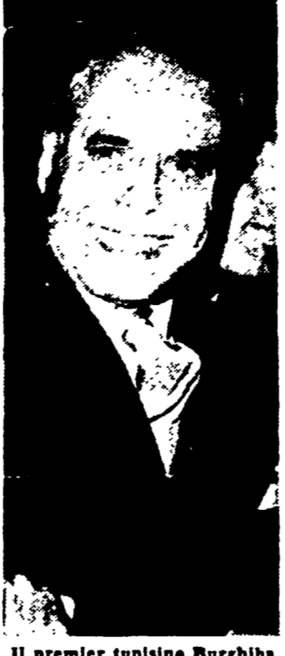
Il premier tunisino Bourguiba