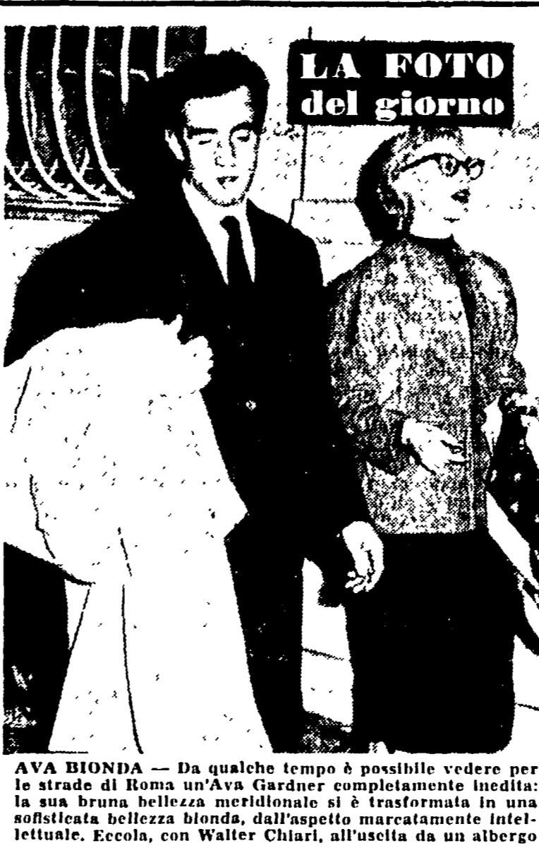
LA FOTO del giorno

Parola di ladro — Anche i ladri, cittadini, sono uomini e come tali soggiacciono alle passioni, compresa quella sportiva. Di ciò non dubitavamo, a dire il vero, ignoravamo però che coloro i quali rubano per professione potessero impegnare in qualche occasione l'onore per rendere indiscutibile una qualsiasi affermazione. E' come se, durante un funerale, il becchino dicesse ai parenti in lacrime: «Io proporzio una bella bevuta. Scusatelo, dicevo tanto per riderci!»