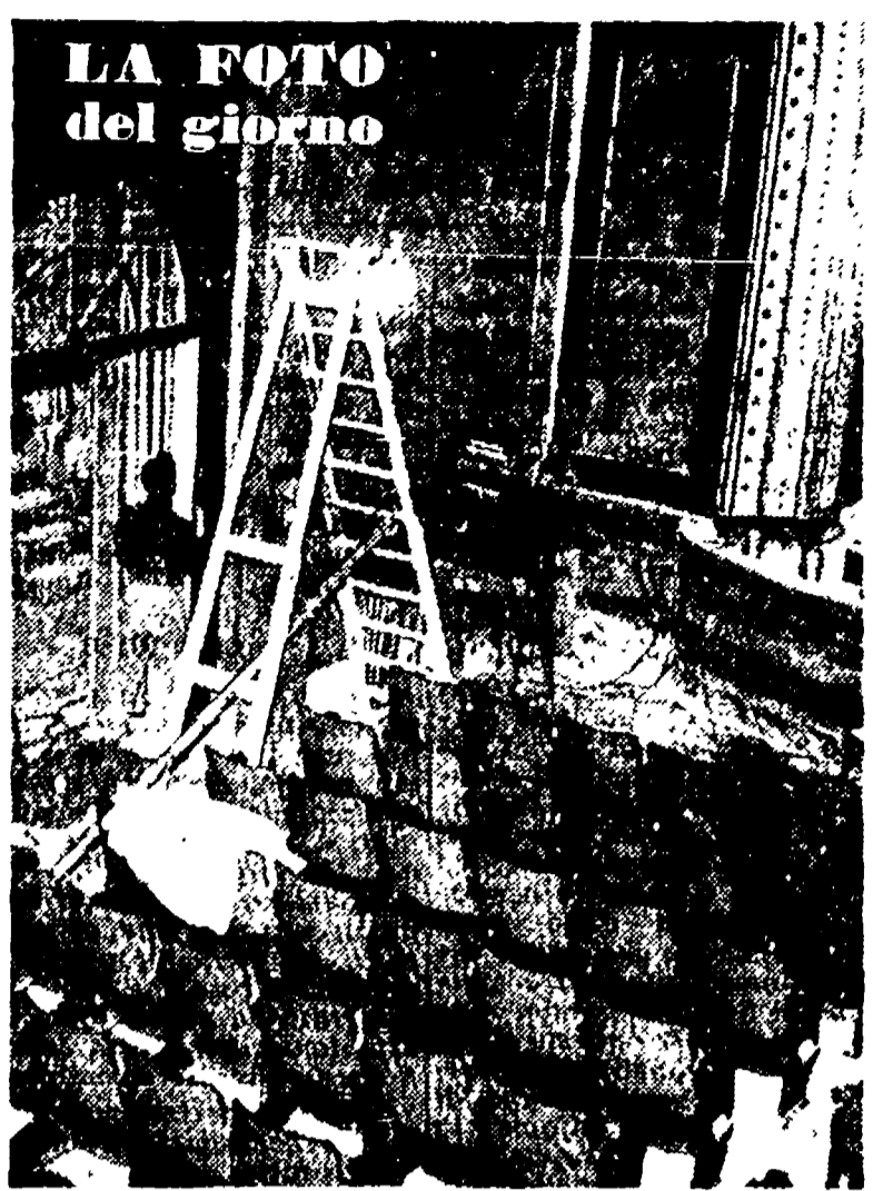
ANCHE I GOLDONI SI RINNOVA - Il settecentesco Teatro Goldoni si sta rinnovando. La piccola, tradizionale fabbrica resta, ma si è arricchita di moderne d'attualità, pur rispettando l'originaria architettura.