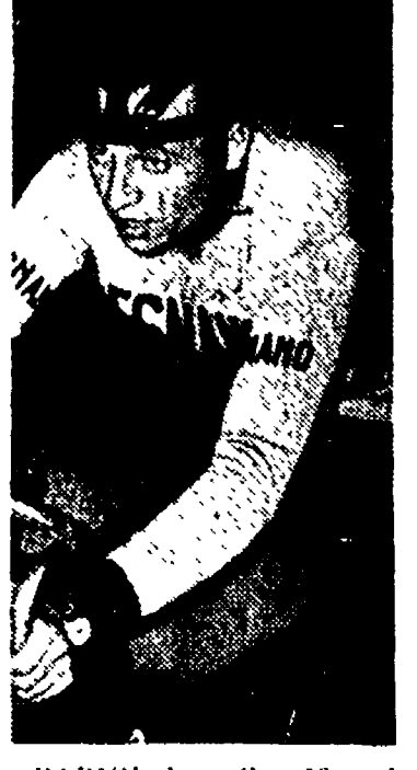
PARIGI, 1. — Con 33 voti favorevoli su 46, è stato assegnato all'italiano Ercolo Baldini, primista mondiale dell'ora, il campionato del mondo d'ingenuità e campione olimpionico su strada, l'undicesimo Trofeo Internazionale Edmondo Gentil, creato per ricompensare l'exploit della stagione ciclistica.

LA STAGIONE CICLISTICA INIZIA CON DUE GARE CHE SI PREVEDONO «TUTTO FUOCO».