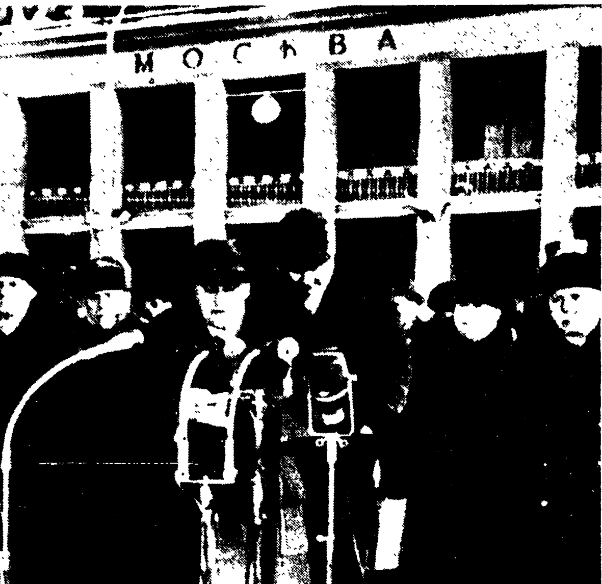
MOSCA - È giunta ieri nella capitale sovietica una delegazione del governo ungherese guidata dal premier Kadar. Ecco all'aeroporto di Vnukovo, da sinistra, Gromiko, Bulganin, Kadar, un interprete, Kruscev e Vorosilov.

GRANDE SUCCESSO DELLA BATTAGLIA COMUNISTA IN SENATO