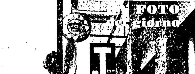
NUOVE INSEGNE - In tutte le tabaccherie vengono cambiate, in questi giorni, le insegne. Il vecchio simbolo verrà sostituito da quello che si vede nella foto: una «T» gialla su sfondo rosso.