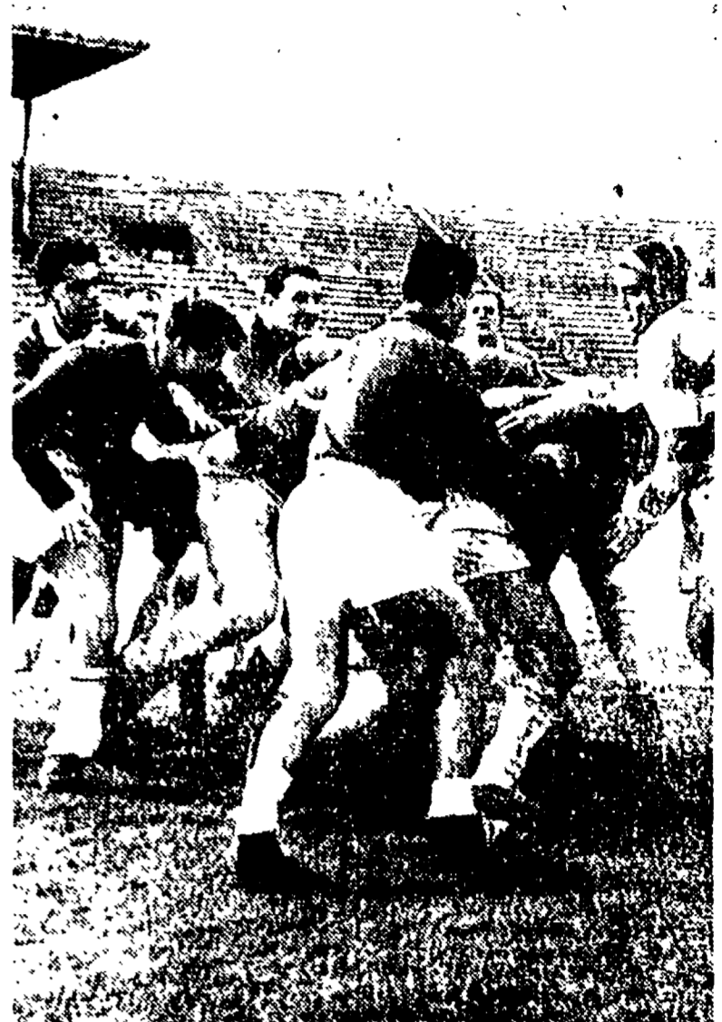
Alcuni momenti della partita Roma-Cus Torino