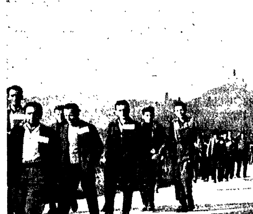
La colonna dei disoccupati di Castiglione d'Orcia in marcia verso la città di Siena