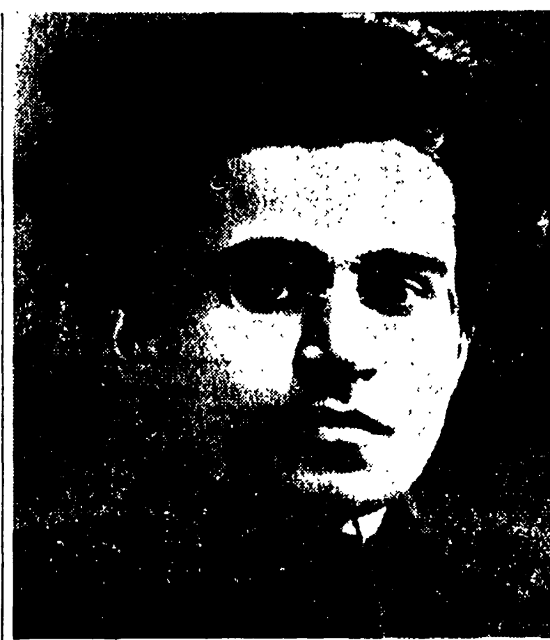
Nuovo sconfitto l'opportunismo di sinistra bordighiano...