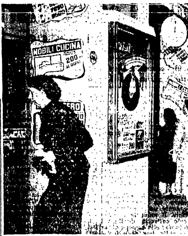
TUTTO A RATE - Ogni negozio espone ormai vistosi cartelli che invitano agli acquisti « a babbo morto ».

III TURNO - Farmacia: via Francesco 28, Prati-Tronfanti, via Attilio Regolo 39, via Gerolamo 82, via Candia 30, via Cavour 55, via Giovinetti 102, via della Giuliana 24, viale Mario 10, viale Medaglie 10, viale S. Maria 10, viale S. Maria 10, viale S. Maria 10.