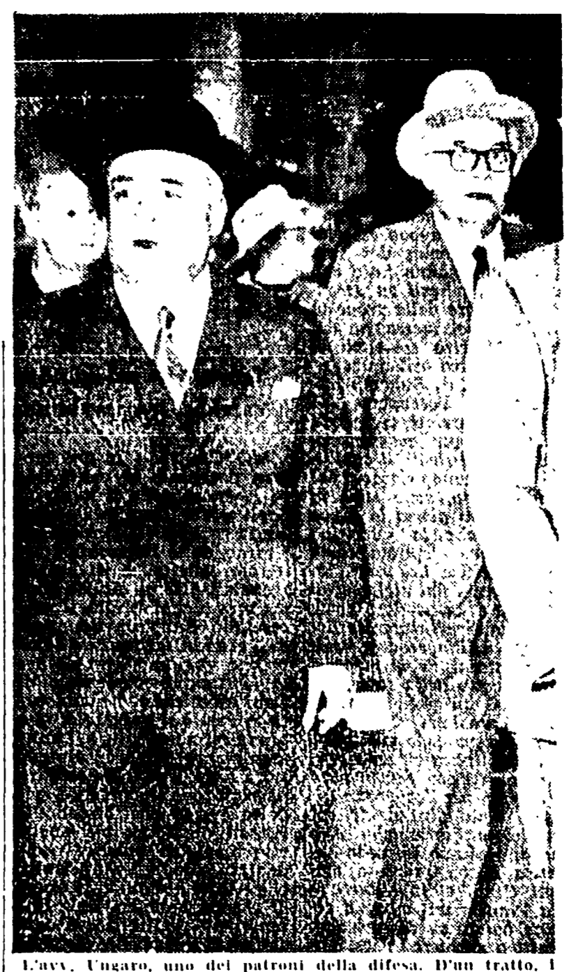
L'Uva. Un'ora, uno dei patron della difesa. Un tratto. I difensori, non hanno più voluto nell'aula la dignità del secolo