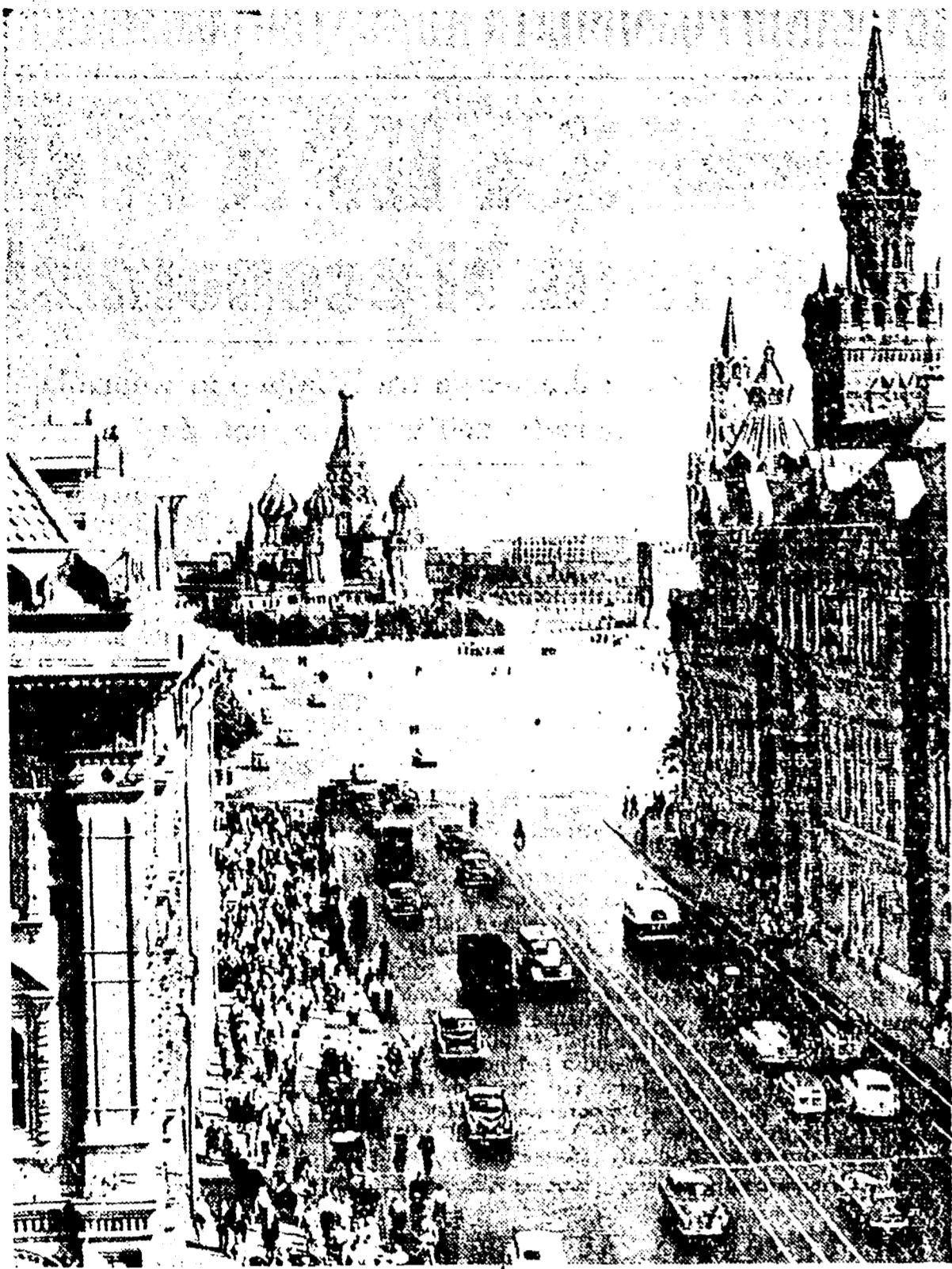
MOSCA - Una veduta della Piazza Rossa ripresa dalla Passeggiata Istoricevskoi

Dal prezzo del soggiorno è escluso il viaggio - Riduzioni del 50 per cento sui mezzi di trasporto all'interno dell'URSS