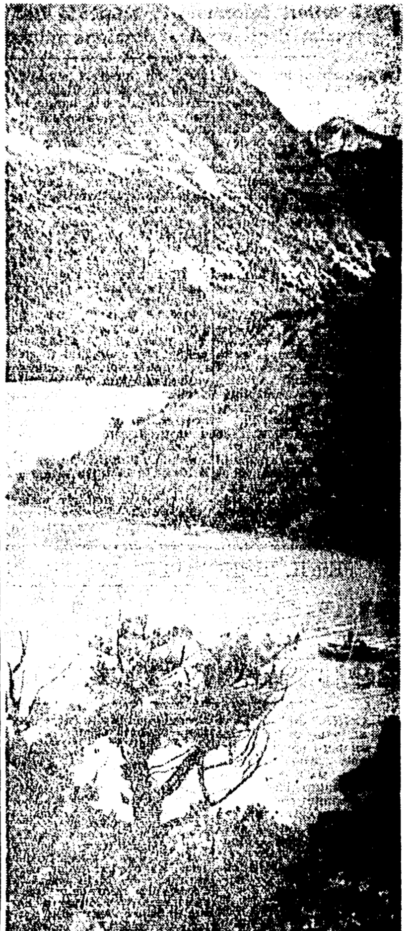
In tutta l'Unione Sovietica i turisti possono trovare innumerevoli angoli suggestivi, i paesaggi più vari e pittoreschi, e comodi ospitalità nelle accoglienti «datche». Nella foto il lago Iskander-Kul nelle montagne del Tagikistan

LA TRADIZIONALE MANIFESTAZIONE FIERISTICA HA RAGGIUNTO LA SUA VENTOTTESIMA EDIZIONE