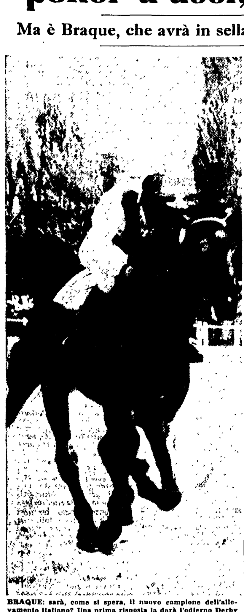
BRAQUE: sarà, come si spera, il nuovo campione dell'avvenimento italiano? Una prima risposta la darà l'odierno Derby