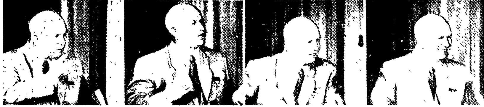
NEW YORK — Quattro espressioni del compagno Krushciov durante l'intervista alla TV americana

NEW YORK, 2. — Milioni di americani sono stati oggi spettatori di un avvenimento senza precedenti, di eccezionale interesse politico e (se possiamo usare questa espressione tratta dal nostro organo di giornalisti) davvero sensazionale. Nikita Krushciov, il primo segretario del Comitato centrale del PCUS, è apparso sugli schermi televisivi degli Stati Uniti, nel corso di un'intervista dal vivo, concessa al Columbia Broadcasting System.