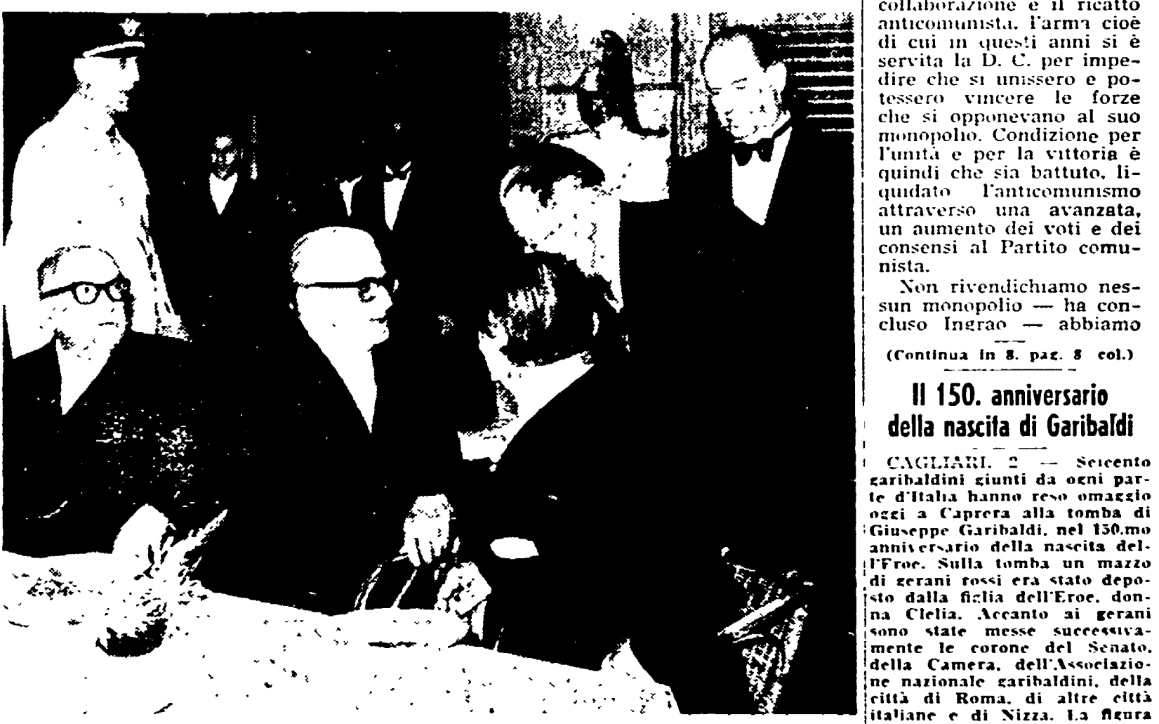
Ieri, nei giardini del Quirinale, si è svolto il tradizionale ricevimento offerto dal Capo dello Stato alle massime autorità, ai parlamentari, agli esponenti della cultura e dell'arte. Nella foto: la cordiale stretta di mano fra Gronchi e Tagliari. Seduti al tavolo sono anche Zoli e Merzagora di spalle