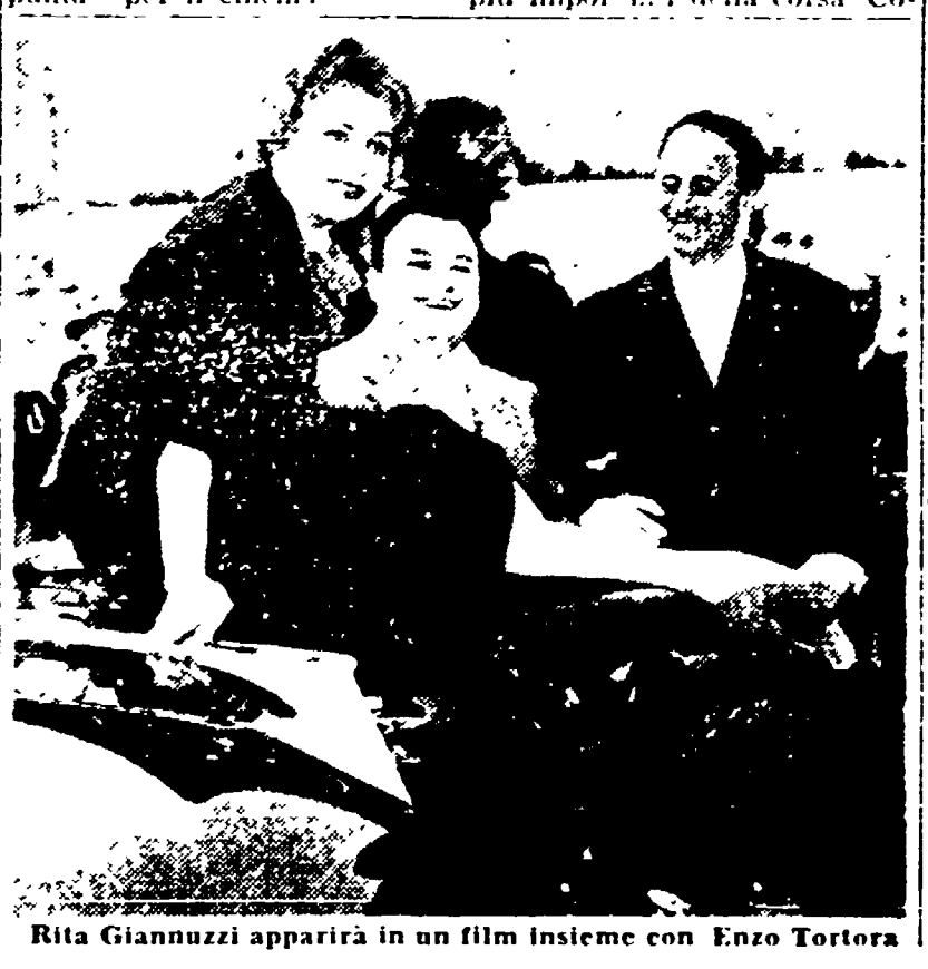
Rita Giannuzzi apparirà in un film insieme con Enzo Tortora