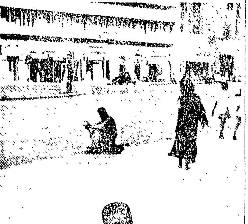
Pomeriggio festivo in una strada di Bombay