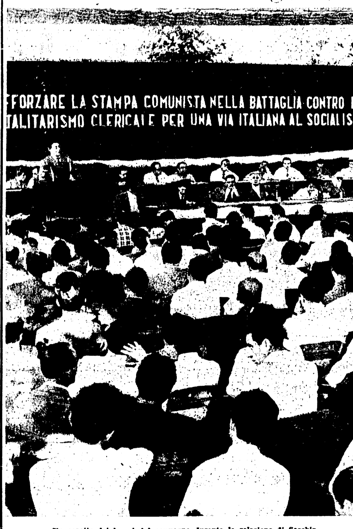
Un aspetto dei lavori del convegno durante la relazione di Secchia