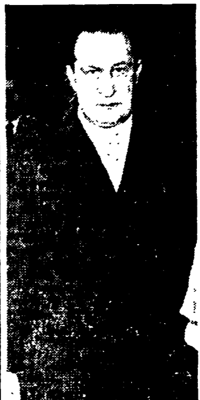
Il presidente Zen

Il teste dice di non averlo mai visto, e che non aveva mai sentito parlare di «Neri». Il teste dice di non averlo mai visto, e che non aveva mai sentito parlare di «Neri».