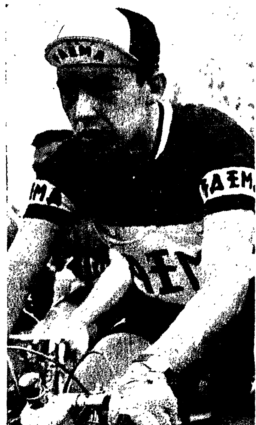
Con GAUL il "Tour" ha perso uno dei più forti motivi di attrazione

Ferlenghi (6°) è il primo degli italiani - Astrua 10° - Nencini, Defilippis e gli altri tricolori a 8'12"