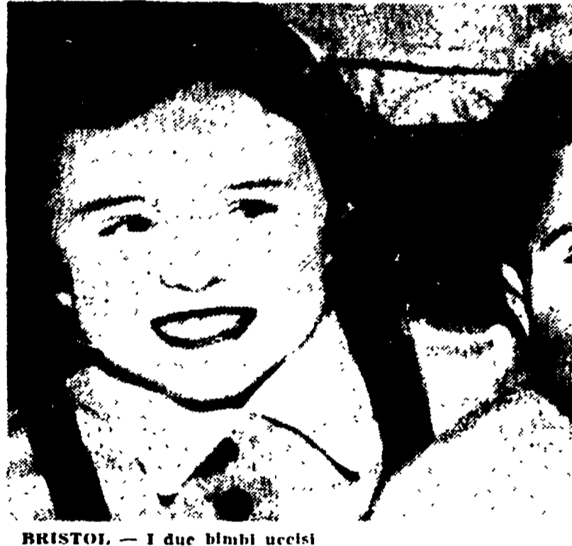
BRISTOL. - I due bimbi uccisi (telefoto)