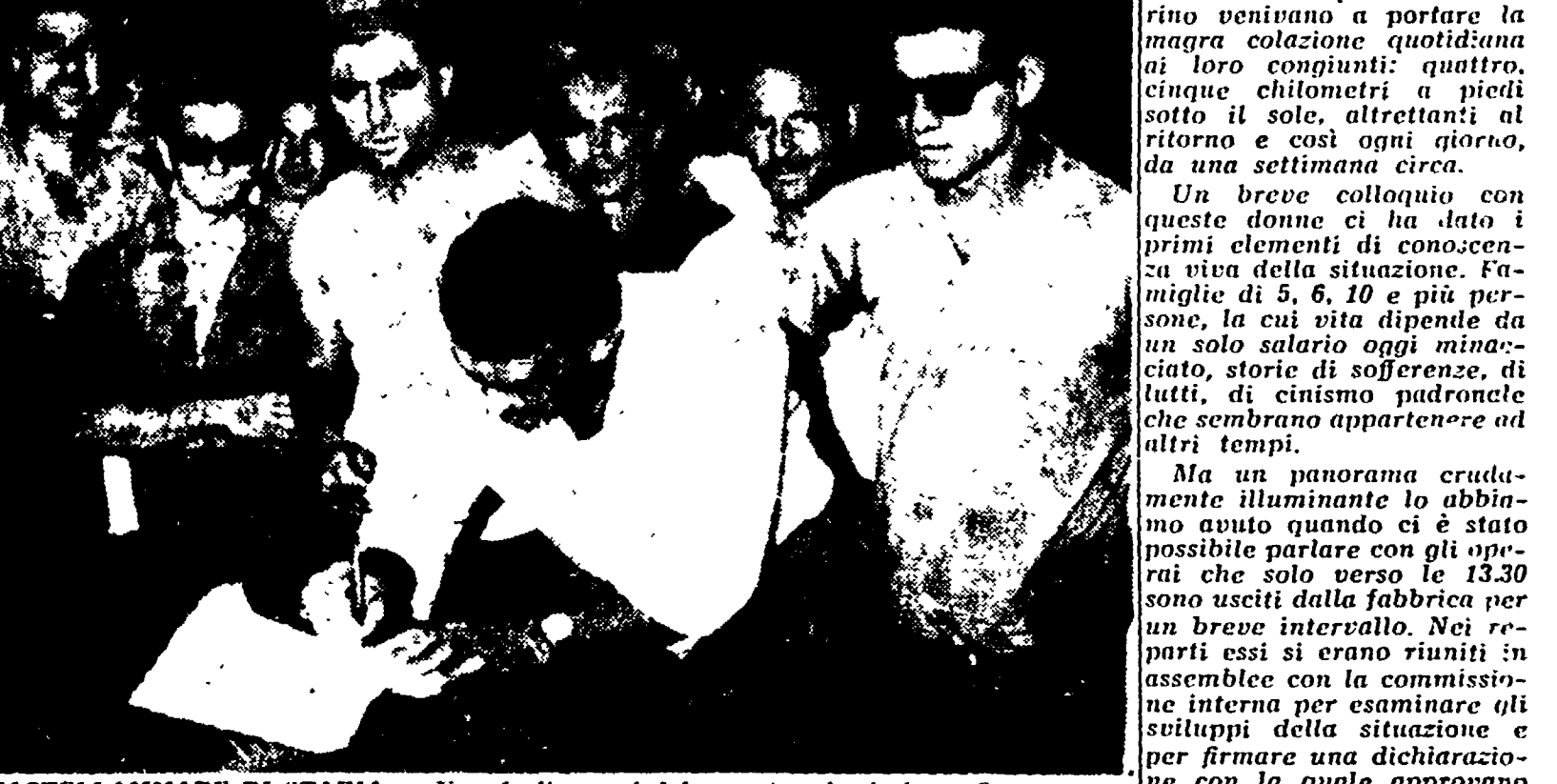
CASTELLAMMARE DI STABIA - Uno degli operai del reparto «lamierino» firma, come hanno fatto tutti i suoi compagni, la dichiarazione con la quale si appropria di un pezzo di fabbrica. Il documento è stato consegnato al sindaco di Castellammare di Stabia, il quale ha dato mandato al sindaco di requisire la fabbrica.

È certo difficile per chi non abbia scapito dal riccio le varie fasi di questa commovente, generosa, ed aspramente battagliata, eppure, raggiunta la popolazione, tutti i ceti sociali stabiesi partecipano unanimemente alla battaglia degli operai del C.M.I. Indubbiamente il peso specifico della classe operaia stabiese, unita e combattiva, è un elemento determinante della situazione; tuttavia non è solo questo il fatto a dare quel tono di appassionata drammaticità che immediatamente colpisce lo