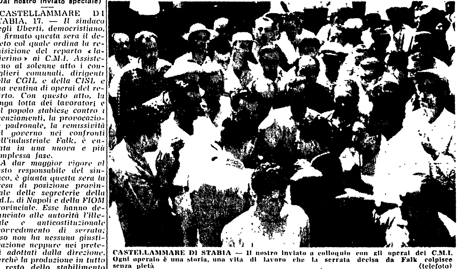
CASTELLAMMARE DI STABIA - Il nostro inviato a colloquio con gli operai del C.M.I. Ogni operaio è una storia, una vita di lavoro che la serrata decisa da Falk calpesta senza pietà.

Il sindaco ha firmato il decreto di requisizione del «lamierino» - La C.d.L. e la FIOM denunciano l'atto incostituzionale di Falk - A colloquio coi licenziati