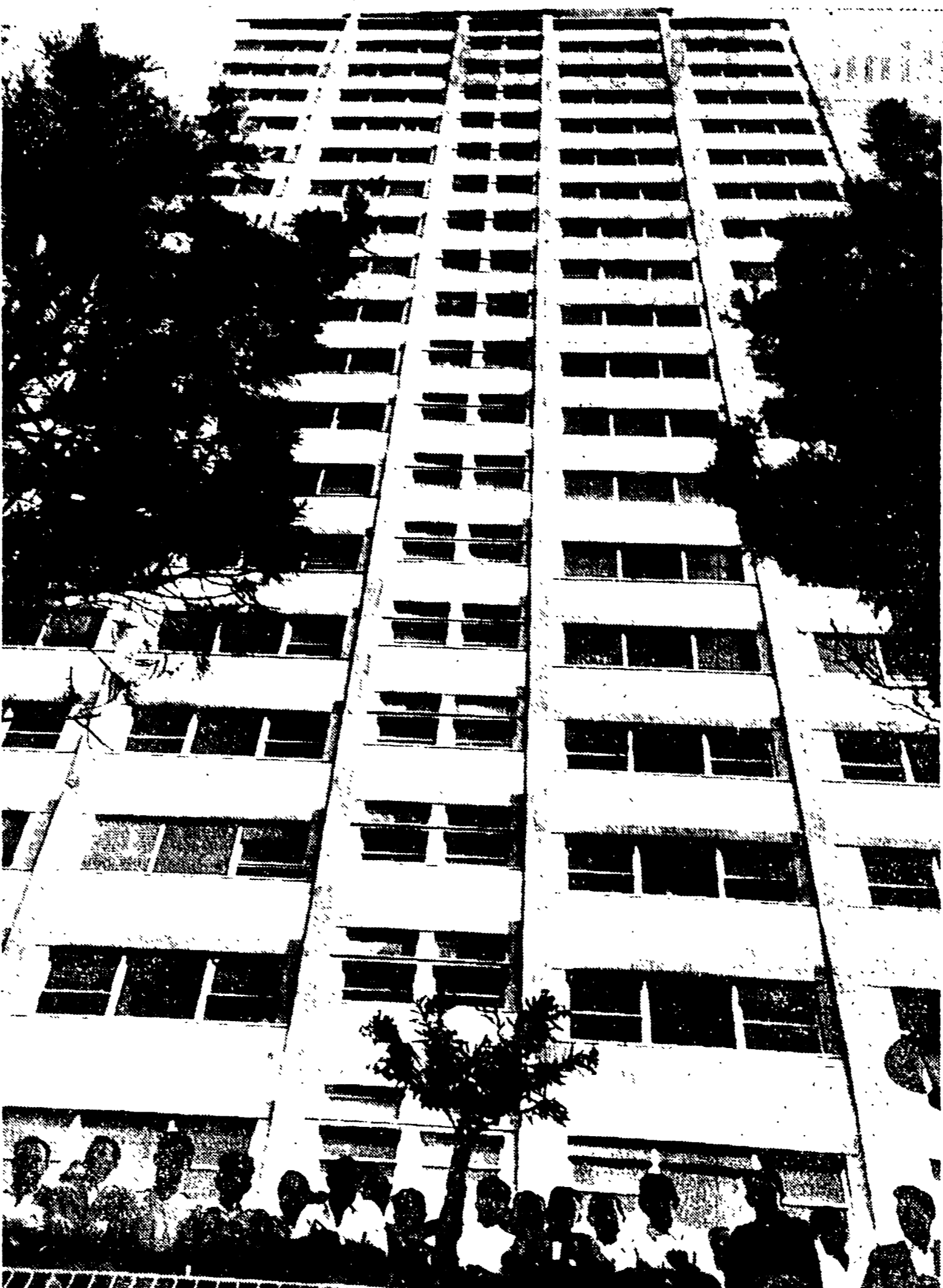
MILANO MARITTIMA (Cervia) - È stato inaugurato un grande grattacielo balneare di 22 piani più due della torretta, per un'area complessiva di metri 87,33. Il grattacielo è stato costruito in soli 10 mesi e mezzo, senza lavorare di notte, grazie ai nuovi sistemi dei cementi ad alta presa e all'abilità di tecnici e maestranze. È stato superato così ogni precedente record di velocità. L'opera è stata realizzata, per conto del progettista ing. Berardi, dalla Cooperativa edile forlivese, aderente alla Lega delle cooperative, che sorge in pianura a pochi passi dal mare; sulla terrazza un gruppo di operai costruttori.

Le trattative per il rinnovo del contratto collettivo di lavoro per le maestranze tabacchine, riprese da alcuni