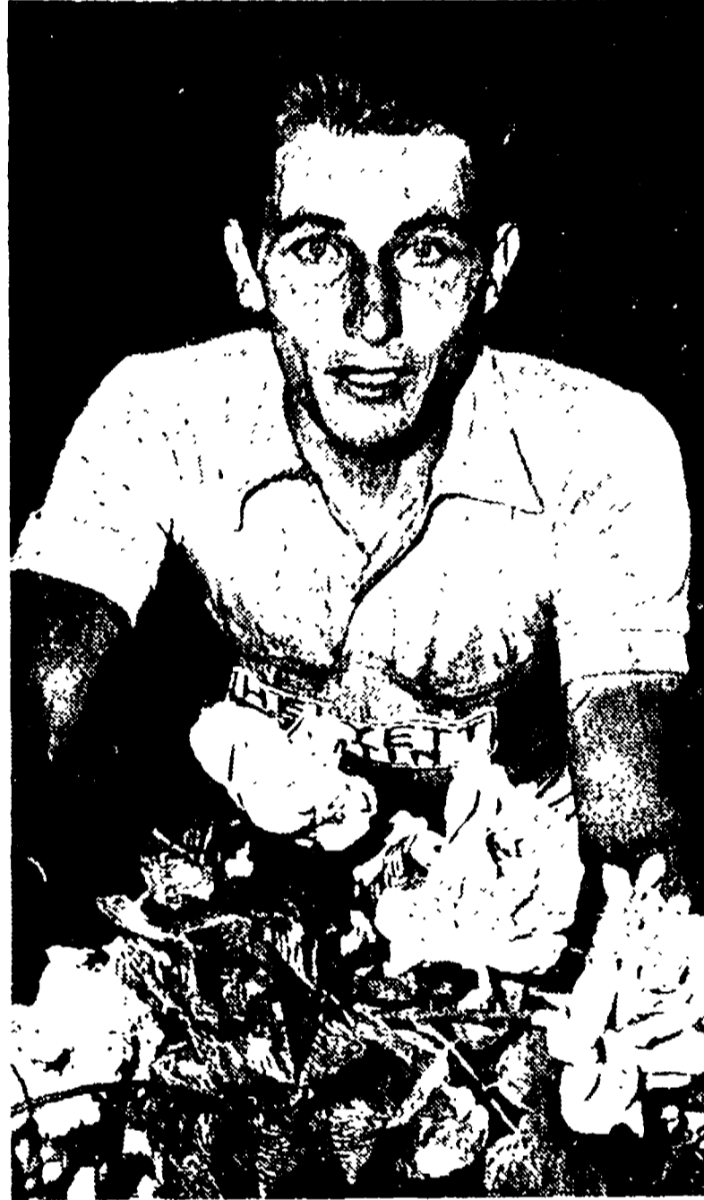
Il francese JACQUES ANQUETIL, brillante vincitore del quarantesimo Tour de France

Nencini e Defilippis figurano fra i piazzati. Non è molto, non possono se lo tengono. Ma i due, con le loro fatiche, gli uomini del Tour - sono stati sottoposti nella prima parte della gara. E poi gli obiettivi puri, che gli atleti della pattuglia bianco rosso e verde hanno raggiunto, sono forse andati al di là delle previsioni. Tenendo conto che il Tour che si è concluso, era matto, e che la situazione del nostro sport è quella che è, in fondo possiamo anche dicitare soddisfatti dei risultati ottenuti: una mezza dozzina di vittorie di tappa, il premio della montagna e la classifica d'onore nella classifica a squadre. Gli atleti della pattuglia bianco rosso e verde rimasti in gara, si mettono in testa di un milione a testa. E Nencini, dice, ha fermato 37 ingaggi.