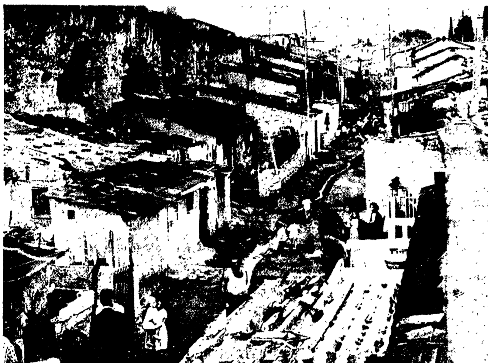
ACQUEDOTTO ALESSANDRINO - È una strada di Roma, ed ha anche un nome: viale dell'Acquedotto Alessandrino. Un inferno malsano alle porte di Torpignattara che il Comune ha i mezzi legali ed i fondi necessari per risanare