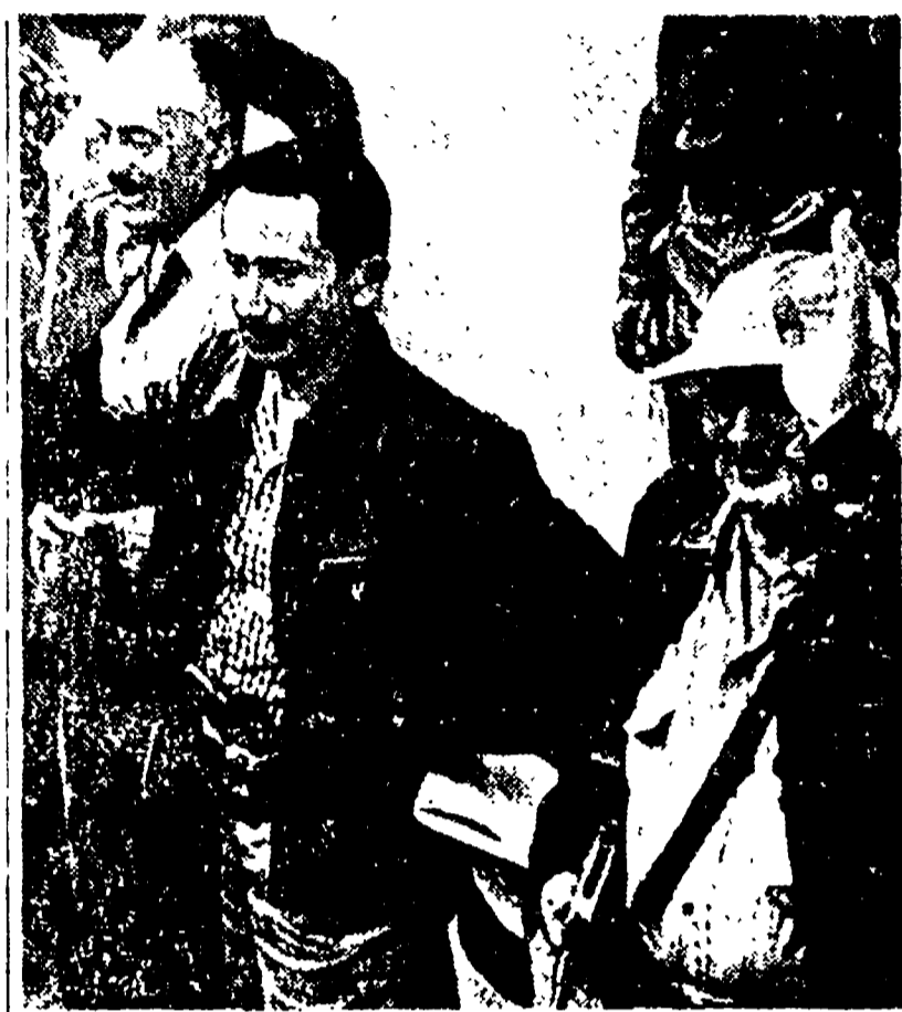
Castillo Armas (col baffetti) subito dopo il colpo di stato

CITTA' DEL GUATEMALA, 27. Il presidente del Guatemala, Carlos Castillo Armas, è stato ucciso ieri sera alle 20,55 (cioè nelle prime ore del mattino di oggi per l'Europa) da un uomo della guardia presidenziale. Il palazzo è stato bloccato ed è stato dichiarato in stato d'assedio, che è stato portato a conoscenza della cittadinanza assieme con la notizia della uccisione di Armas; nello stesso tempo si è appreso anche che il presidente Luis Arturo González López aveva preso il posto del defunto presidente, pronunciando il giuramento di fedeltà al paese. In un cuore il coprifuoco dalle 21 alle 6, sono previsti i riunioni di più di quattro persone, anche nelle case private; è sospesa l'attività dei partiti politici. Il regime, insomma, ha revocato l'ordine di coprifuoco e l'esplosione di quello con cui il popolo del Guatemala avrebbe certamente