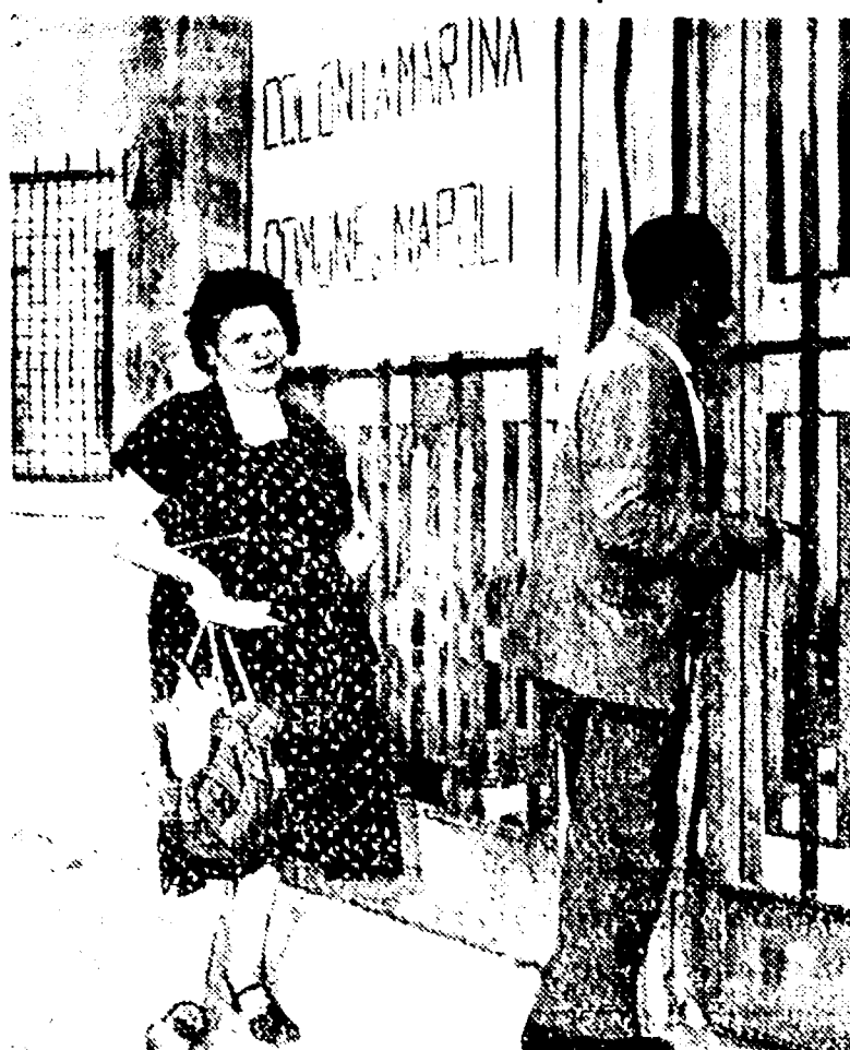
TOR VAJANICA — All'incasso della colonia marina «San Giuseppe» sostano i parenti delle bambine ammalate

In seguito all'epidemia di infezione sviluppata fra le 115 bambine della colonia marina «San Giuseppe» di Tor Vajonica ha disposto un rigoroso e assiduo controllo sanitario, con appositi servizi di pulizia e di igiene personale e collettiva.