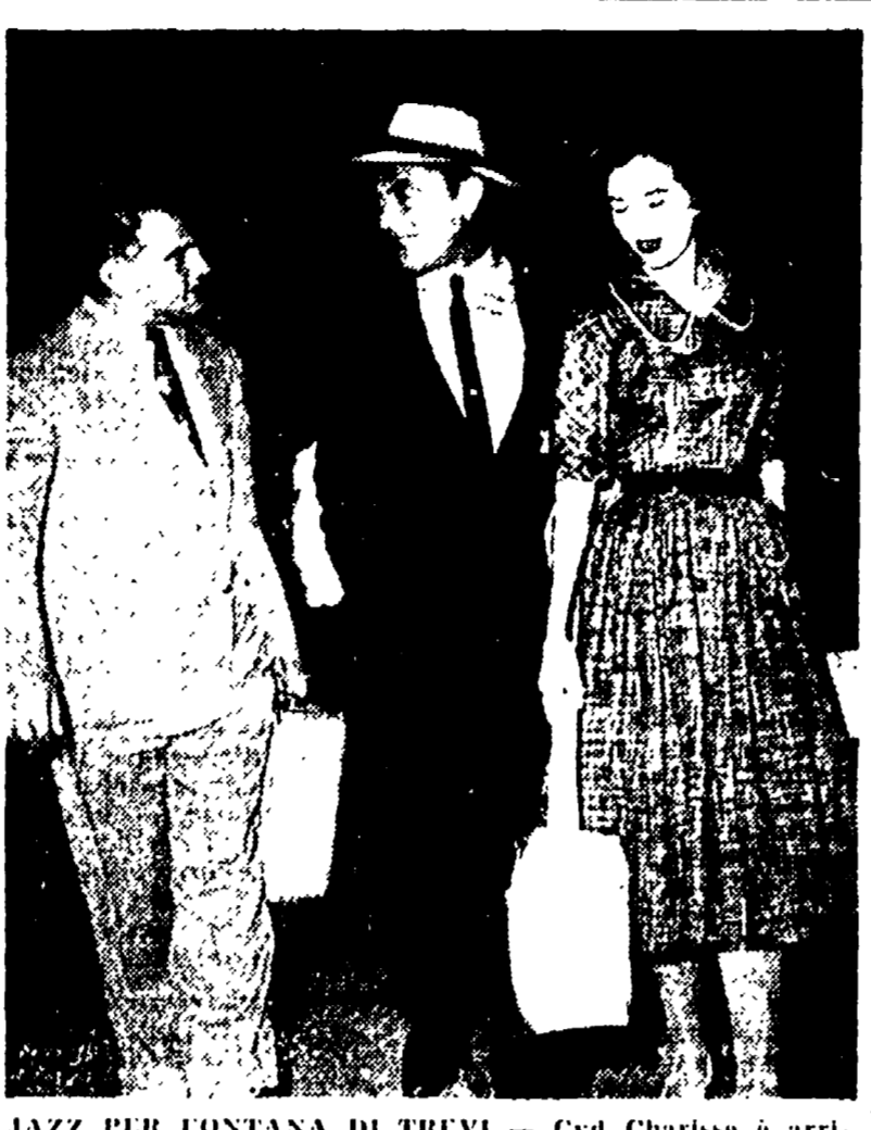
JAZZ PER FONTANA DI TREVÌ — Cyl Charisse è arrivata a Roma con il marito per studiare la realizzazione di un balletto-jazz ispirato ad alcuni monumenti classici di Roma, in particolare alla Fontana di Trevi

Senza dire che molta parte dei programmi di intervento dell'Amministrazione avrebbero potuto essere realizzati con la soluzione di quanto non lo siano oggi.