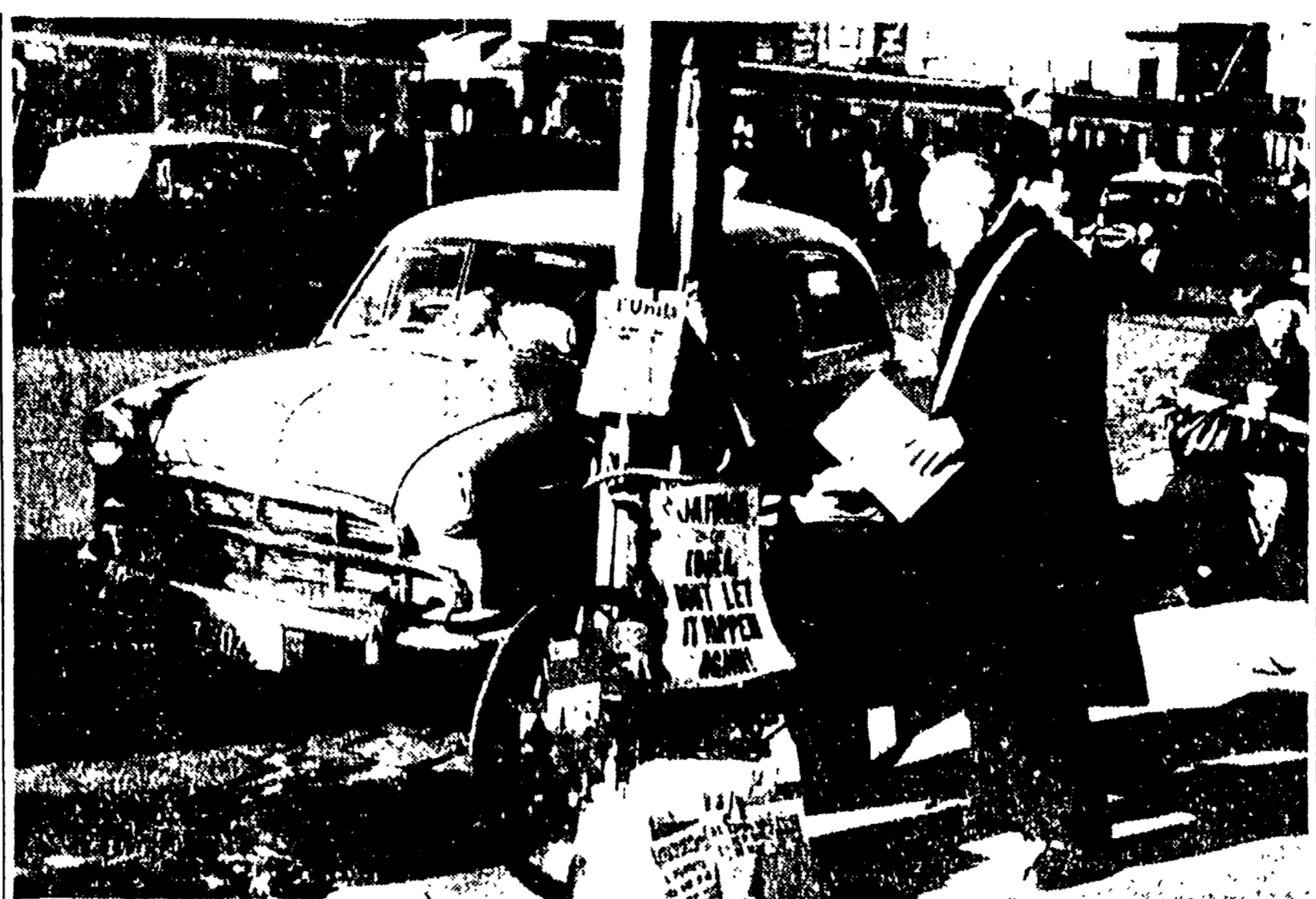
SIDNEY. - In occasione del mese della stampa, i compagni residenti in Australia hanno preso una serie di iniziative...