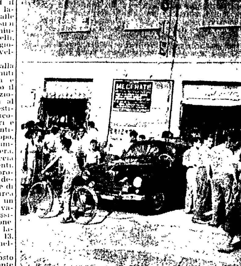
L'ORFICERIA SVALIGIATA - Folla di curiosi davanti al negozio di via dei Castani pieno di mitra dai ladri