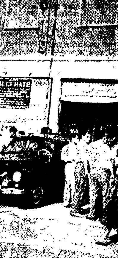
L'ORFICERIA SVALIGIATA - Folla di curiosi davanti al negozio di via dei Castani pieno di mitra dai ladri