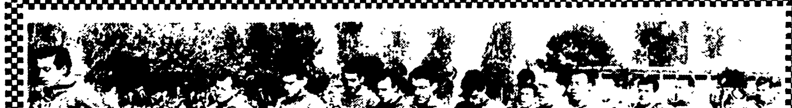
2 - IN PASSERELLA LE PROTAGONISTE DEL TORNEO