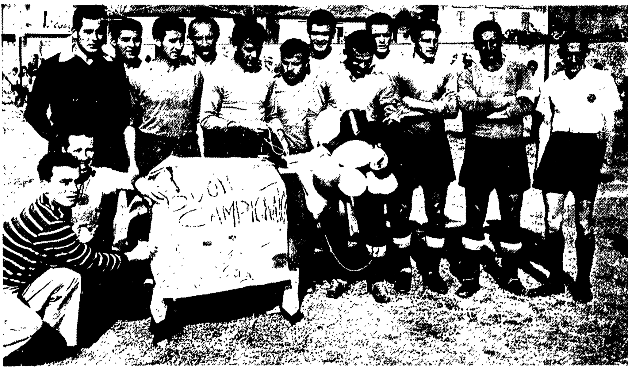
I tifosi napoletani hanno portato a Rieti, nel «ritiro» degli azzurri, il «ciclino» portafortuna dei loro colori: buon campionato al ragazzi di Amadei ma, soprattutto, buon campionato 1957 a tutte le squadre e ai tifosi italiani

OGGI VENGONO ASSEGNATE LE MAGLIE TRICOLORI