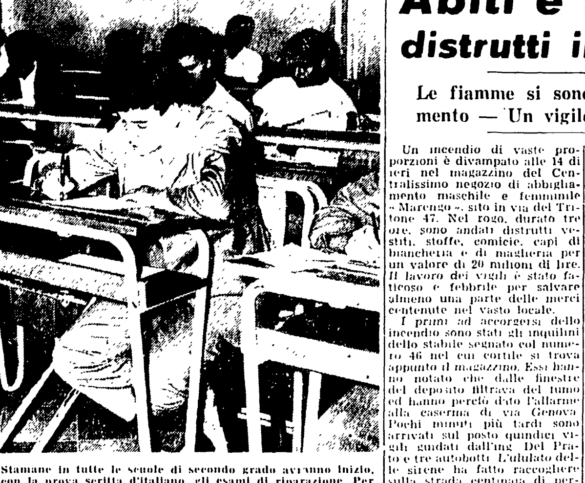
Stamani in tutte le sale di secondo grado avranno inizio...