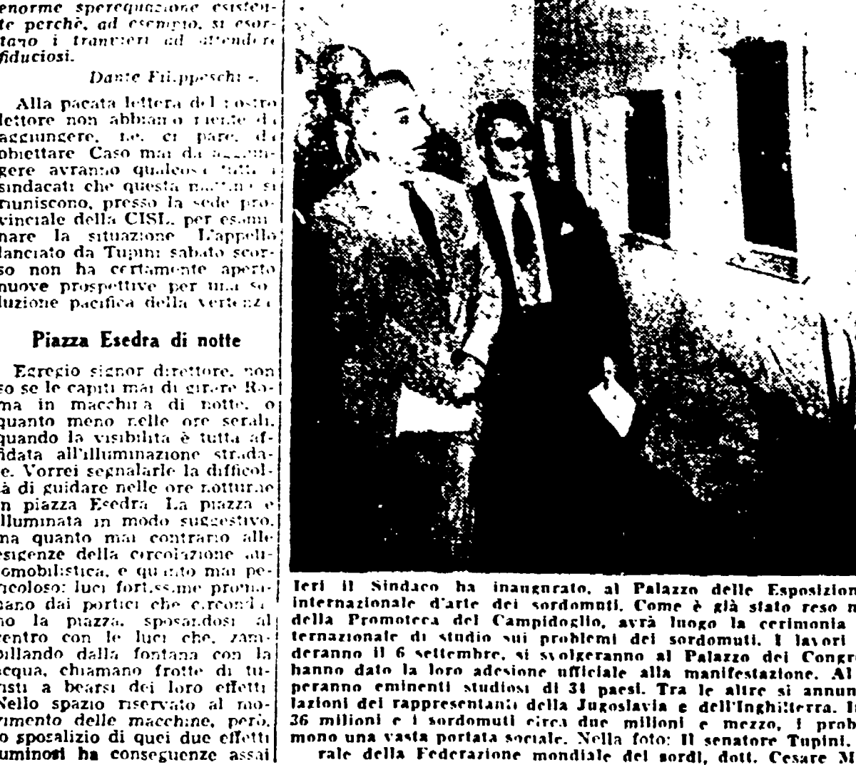
Ieri il Sindaco ha inaugurato, al Palazzo delle Esposizioni...