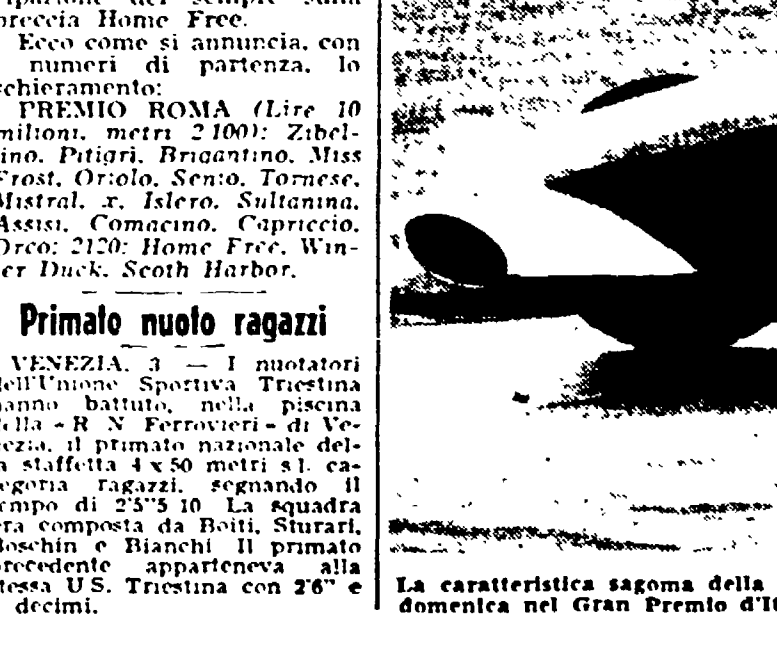
La caratteristica sagoma della Vanwall, il bolide inglese che ha messo nei pasticci i piloti delle Maserati e delle Ferrari e che domenica del Gran Premio d'Italia a Monza partirà ancora con il ruolo di grande favorito. Nella foto: STIRLING MOSS