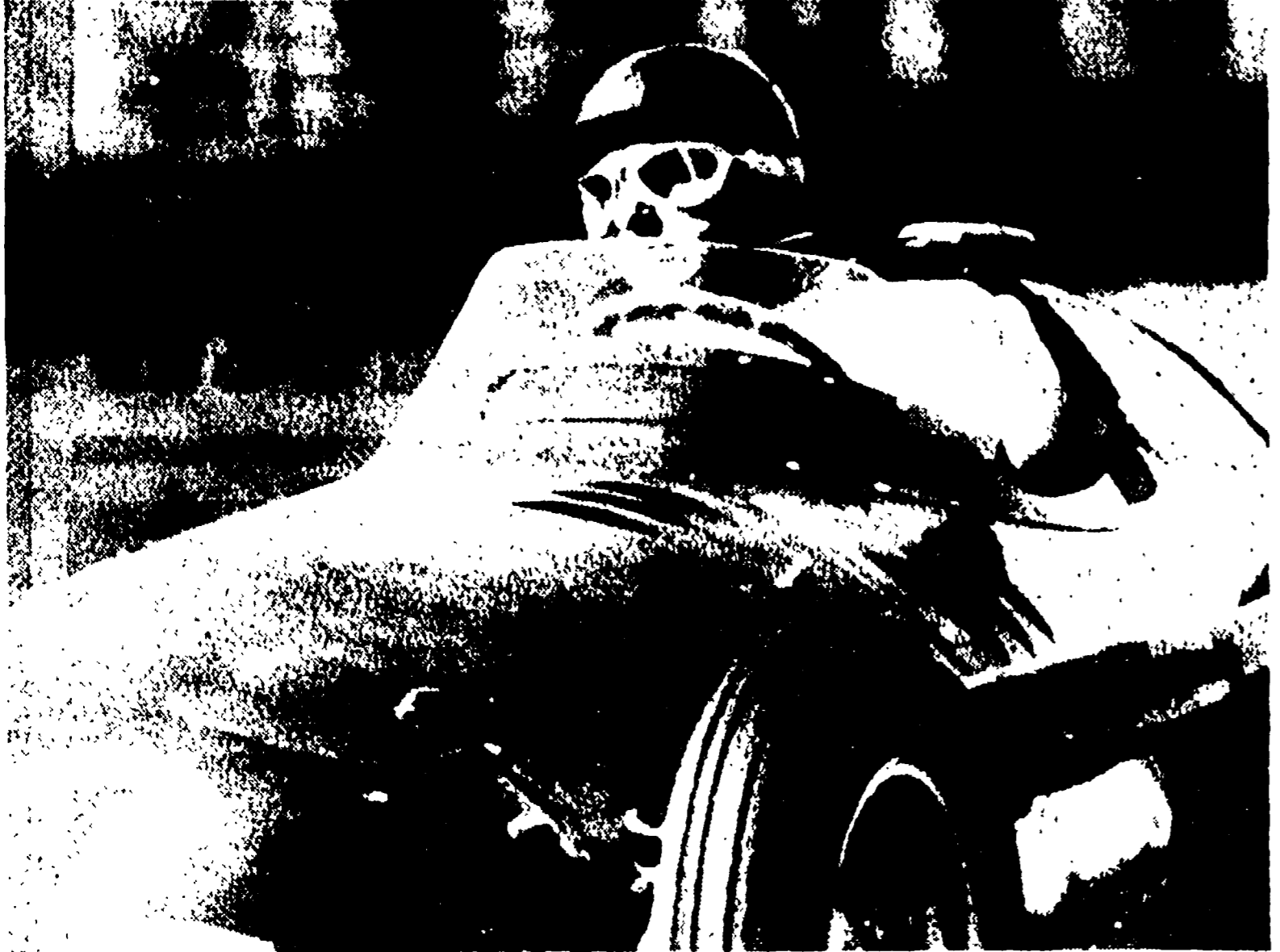
L'argentino Manuel Fangio con una brillante condotta di gara ha conquistato la seconda piazza nel XVIII Gran Premio d'Italia, che ha visto il trionfo di Moss e della Vanwall. Fangio ha così vinto il suo quinto, ultimo mondiale. Musso ha deluso le aspettative degli sportivi. Nella foto: il fuoriclasse argentino in piena azione