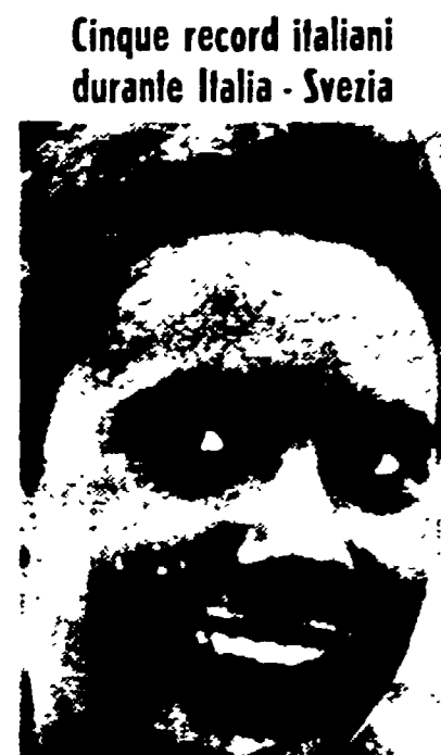
Cinque record italiani durante Italia-Svezia

Il vincitore ha avuto ragione di Ivozio, Mosconi e Otsego grazie ad una brillante volata finale - Aleppo battuto dal «vecchio» Zarese