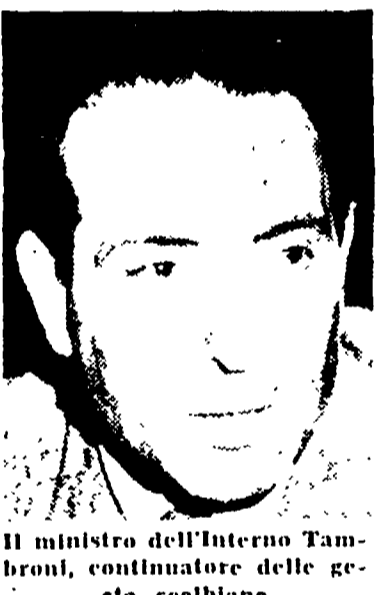
Il ministro dell'Interno Tambroni, continuatore delle gesta scabiose