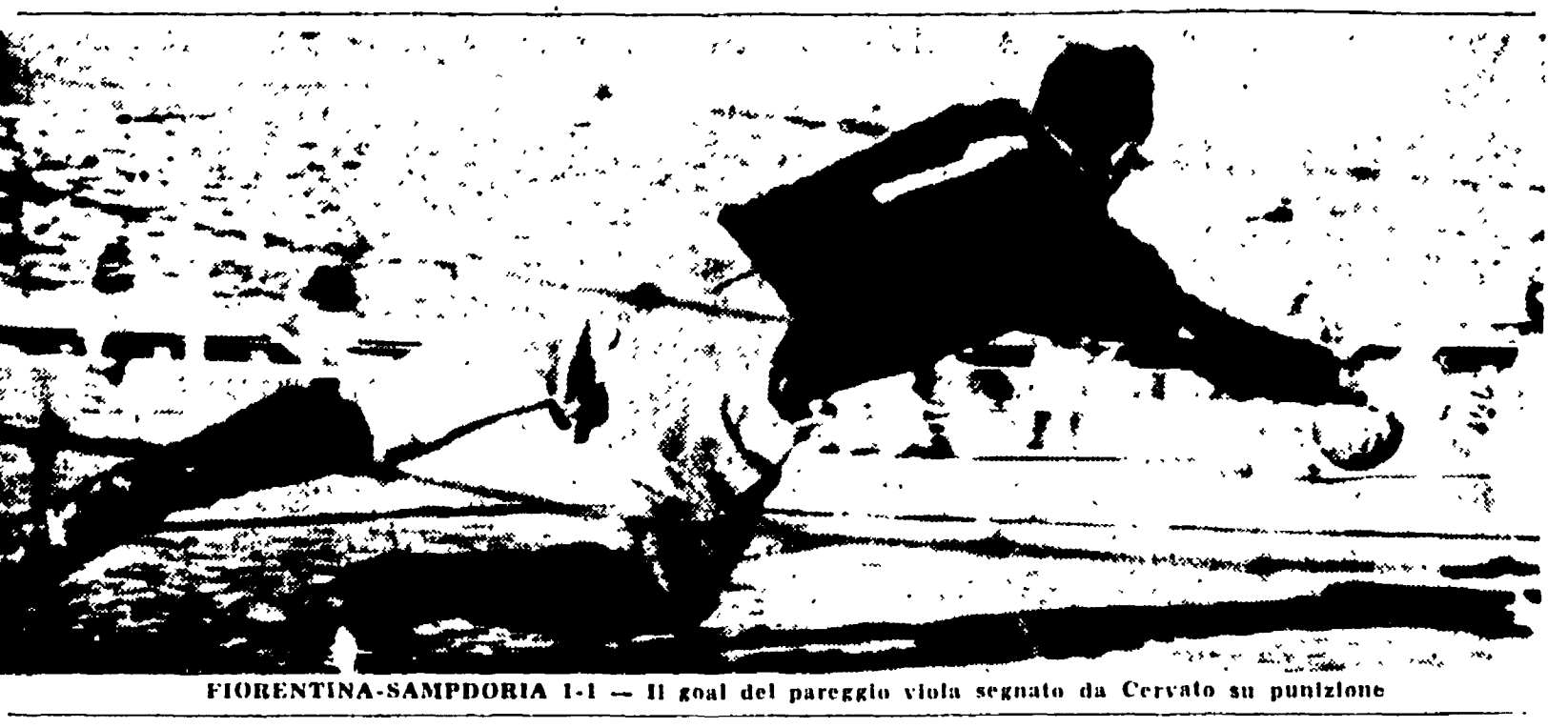
FIORENTINA-SAMPDORIA 1-1 - Il goal del pareggio viola segnato da Cervato su punizione