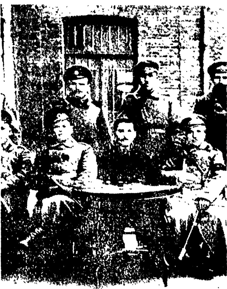
Voroshilov tra i membri della sezione militare del Soviet dei deputati operai e soldati di Lugansk.