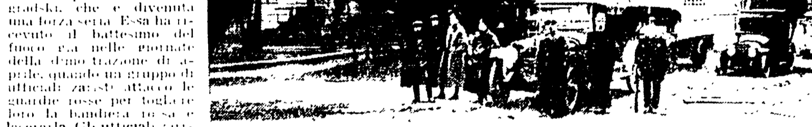
L'Istituto Smolny, quartiere generale dello Zik e del Soviet di Pietrogrado.