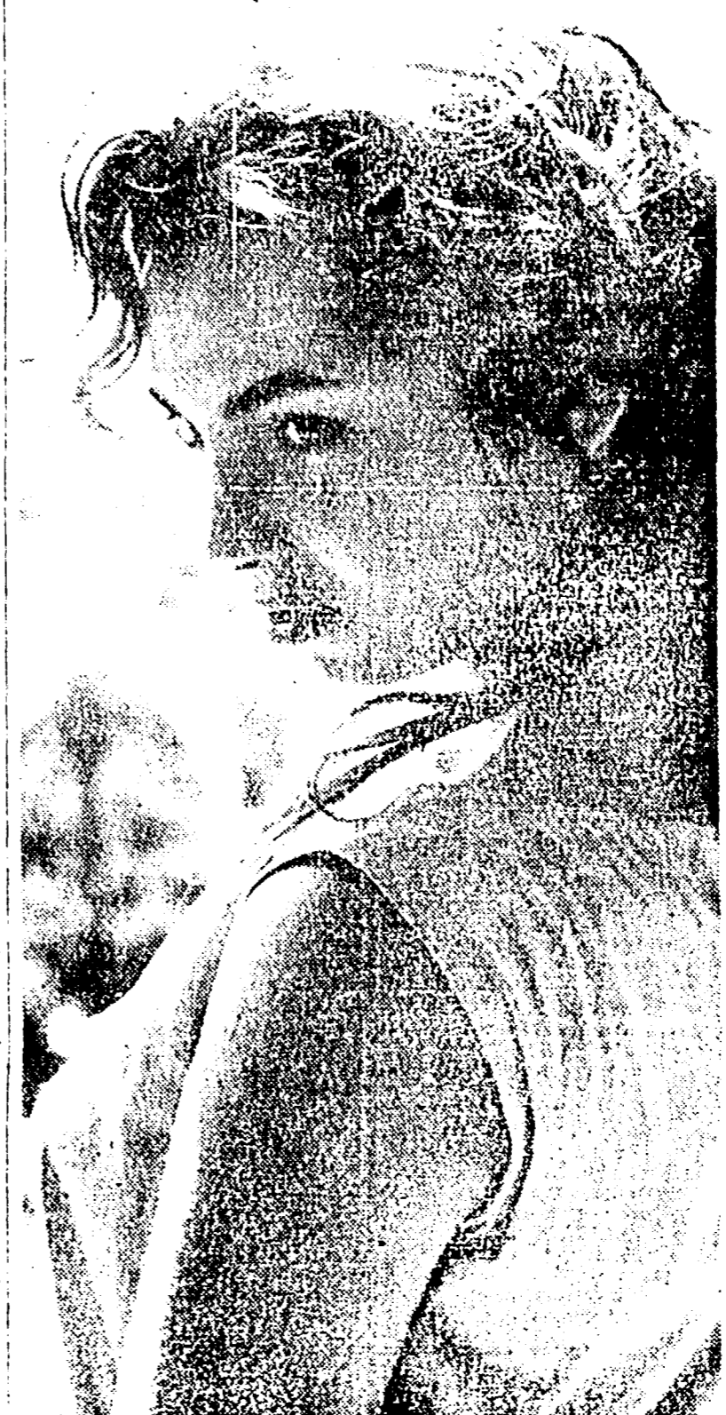
Si sono concluse a Napoli le riprese del film «La Stella» ambientato nel mondo della camera e diretto dal giovane regista...