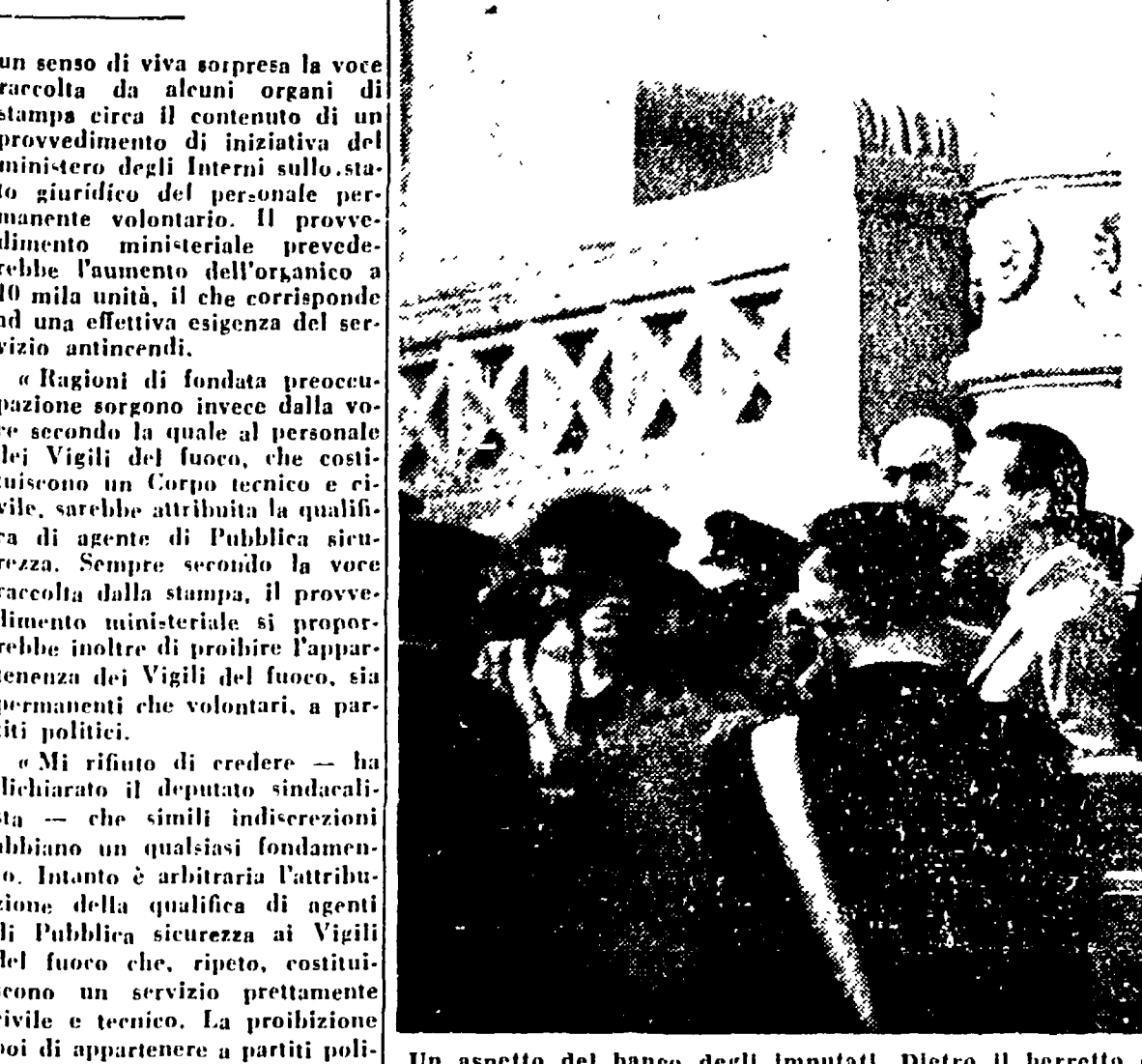
Un aspetto del banco degli imputati. Dietro il berretto di un carabinieri si intravede il De Seta

Il dibattimento rinviato al 5 - Gli imputati Masselli e Ferrari chiariscono ancora la posizione dell'ex console - Nuovo attacco al commissario Dante