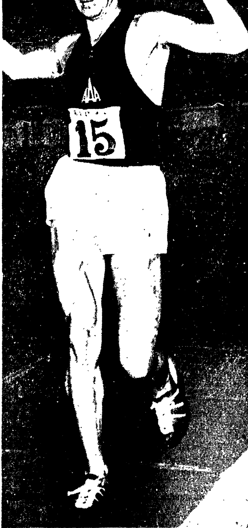
ABDON PAMICH tenta anche lui l'avventura nella «Cento» come Dordoni che nel '49, da esordiente, vinse la classica gara

La «Cento» sarà dunque dura, quest'anno: e maggior prestigio avrà Pamich se riuscirà a cogliere la significativa vittoria, quella vittoria che gli consentirebbe, quindi, di sperare anche in una sua affermazione ai prossimi campionati europei di Stoccolma sulla tradizionale distanza dei 50 chilometri.