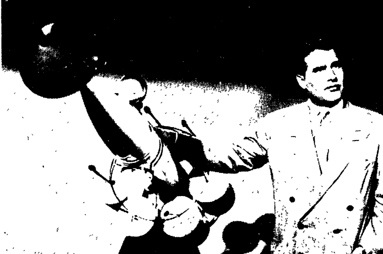
NEW YORK — Werner von Braun, il tedesco inventore della «V2» nazista, impiegata nell'ultimo anno di guerra contro Londra, è attualmente direttore delle ricerche al Centro Missili dell'esercito degli Stati Uniti.

Un rapporto del ministero dell'Istruzione di Washington sottolinea che le materie scientifiche sono studiate dai sovietici con più attenzione che dagli americani