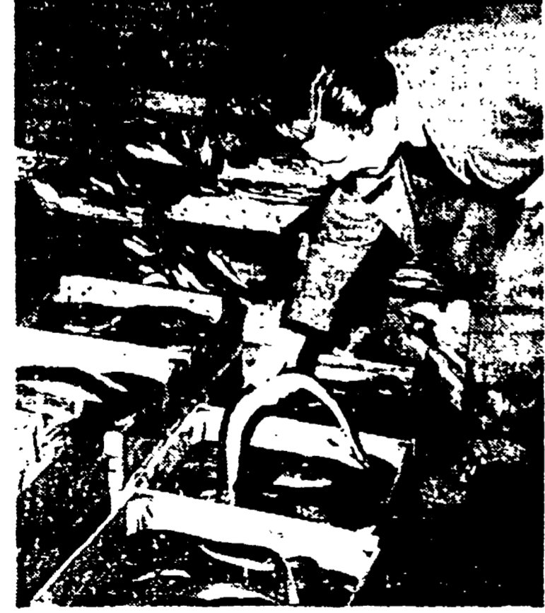
E' ARRIVATO IL CAPITONE - Anche prima del tradizionale « cotto » sono giunti notevoli quantitativi di caploni per il pranzo di Natale