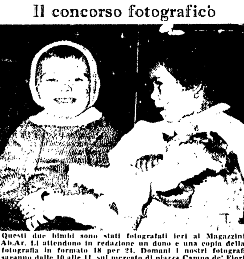
Questi due bimbi sono stati fotografati ieri ai Magazzini Ab.Ar. Li attendono in redazione un dono e una copia della fotografia in formato 18 per 21. Domani i nostri fotografi saranno dalle 10 alle 11, sul mercato di piazza Campo de' Fiori

Urge sangue I familiari di un degente al Policlinico rivolgono a mezzo nostro, un appello ai donatori: urge sangue per una imminente operazione. Si prega di telefonare, da una mattina al Sindacato ferroviario, 749-671.