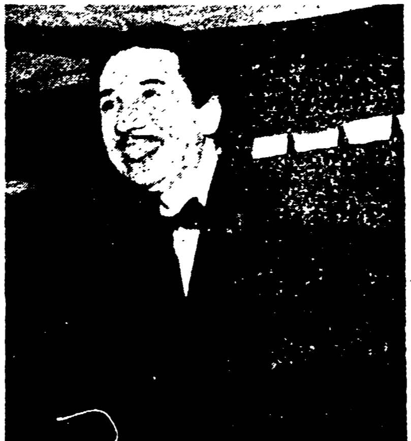
Gorni Kramer dirige l'Orchestra Ritmica alle finali del torneo « Voci e volti della fortuna » (21,30)

TELEVISIONE Ore 10.15: « La casa di P. De Felice ». Ore 11.00: « La casa di P. De Felice ».