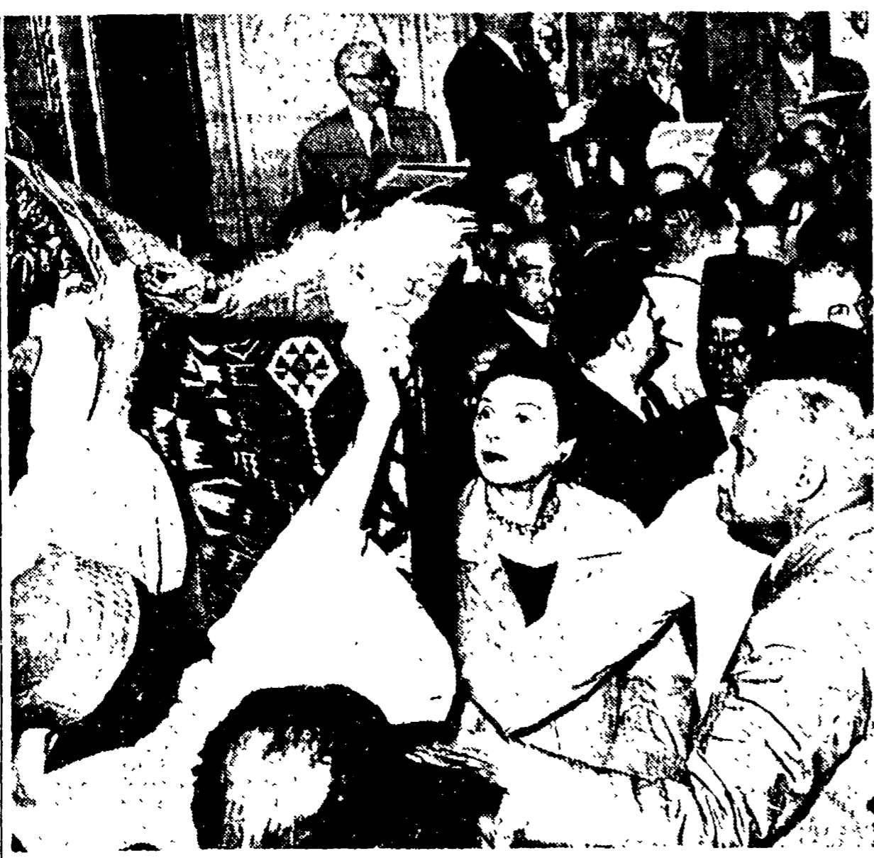
IL CAIRO - Nei saloni dell'Palazzo Reale egiziano, sono stati messi in vendita numerosi oggetti di pregio, fra i quali splendidi tappeti, gli appartamenti all'ex re erano l'arredo delle sue mogli Farida e Narriman. L'asta è apparsa molto affollata, come la foto dimostra

UN giorno un prete incontrò alle porte di un villaggio un ragazzo che conduceva al pascolo una mandria di porci. Chiese il prete al piccolo mandriano: « Dove conduci queste bestie? »