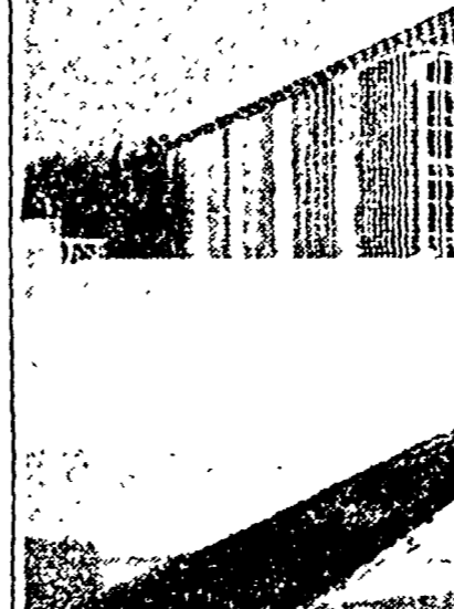
Il padiglione dell'URSS, opera degli ingegneri Borzicki, Abramov, Dubov, Polanski, è costituito di un'ossatura metallica...